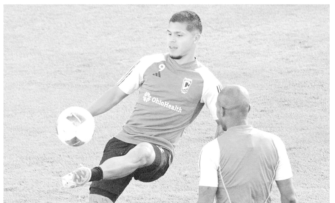
COLUMBUS CREW se reportó listo para enfrentar al Pachuca en el primer partido de la gran final.