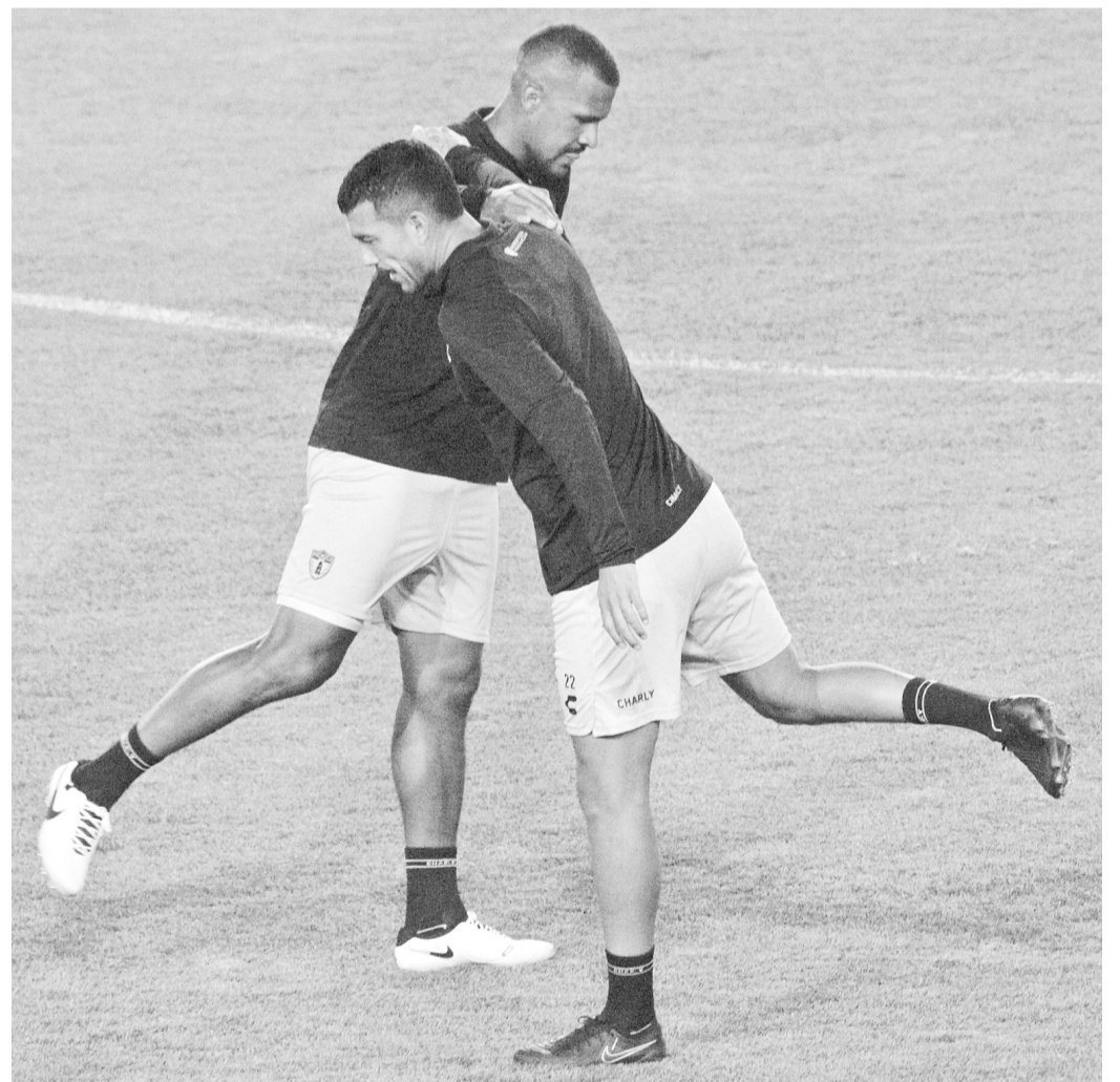
ESCENAS del entrenamiento del Pachuca previo del partido entre Tuzos y Columbus.