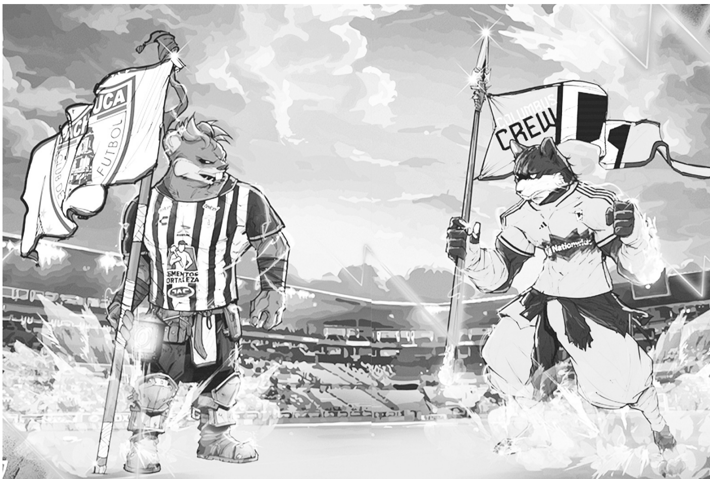
LLEGÓ la hora de la verdad para los Tuzos del Pachuca y el Columbus Crew para disputar su lugar en el Mundial de Clubes.